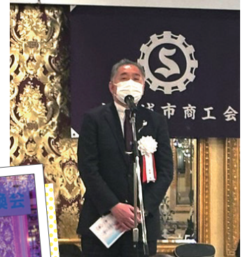
花田会長あいさつ